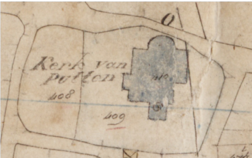
De Oude Kerk op het minuutplan [1]

Als we op de kaart van Putten uit de periode 1811-1832 kijken (minuutplan) dan vinden we op sectie C, blad 4, de Oude Kerk.